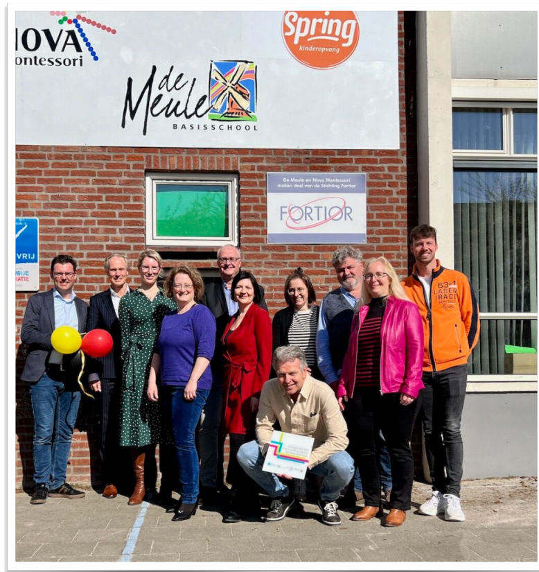
Foto oben (euregio rhein-maas-nord): deutsche und niederländische Kinder sangen Snappie, de kleine Krokodil, das kleine Krokodil auf dem Schulhof in Venlo.

Auch der Minister für Bundes- und Europaangelegenheiten, Internationales sowie Medien und Chef der Staatskanzlei des Landes Nordrhein-Westfalen, Nathanael Liminski sieht den Mehrwert: „Junge Menschen haben am wenigsten Berührungängste, von daher ist das Engagement der Nova Montessori Schule ein leuchtendes Beispiel dafür, die Potenziale der Grenzregion auszuschöpfen. Die Zertifizierung als Euregio-Profilsschule ist eine angemessene Würdigung dieses außergewöhnlichen Einsatzes für die grenzüberschreitende Freundschaft unserer Länder.“